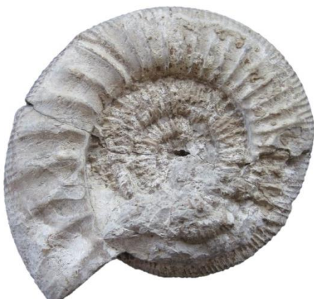
Ammonit aus dem Oberjura

Mit der schwäbischen Alb findet die süddeutsche Schichtstufenlandschaft, die in der Basis mit Buntsandstein, Muschelkalk und Keuper beginnt, ihre Fortsetzung. Schon weit vor der deutlichen Kante des Albtraufs setzt der „schwarze“, oder besser gesagt